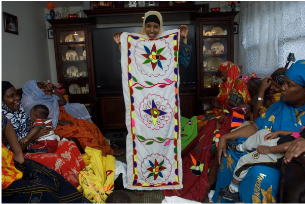
Вишивка сомалійського банту