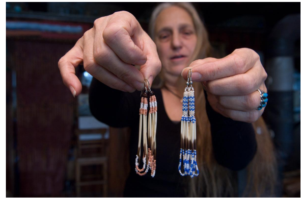
Абенаки вишивка бісером