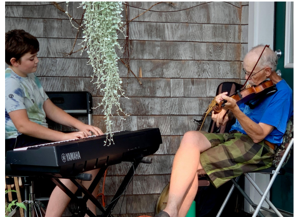
Musique pour la danse de la Nouvelle Angleterre